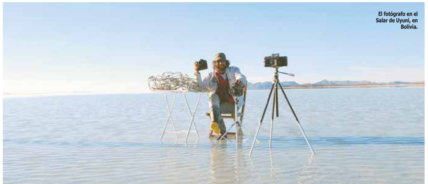
El fotógrafo en el Salar de Uyuni, en Bolivia.